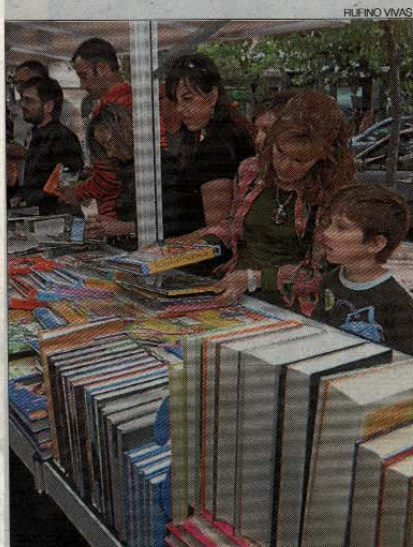
▶▶ Visitantes en un estand de la feria.