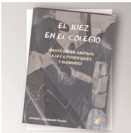
Portada del libro de editorial Abecedario.

Y en todo el recorrido, en todas y cada una de las páginas, el protagonista central es el juez, que entra en cualquier colegio,