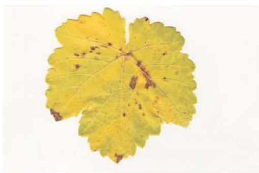
La hoja de parra, un ‘símbolo’ muy recurrente.

Es imprescindible reconocer a los niños/as como seres sexuados en relación consigo mismos y con otros, para que puedan construir una identidad sexual propia y saludable.