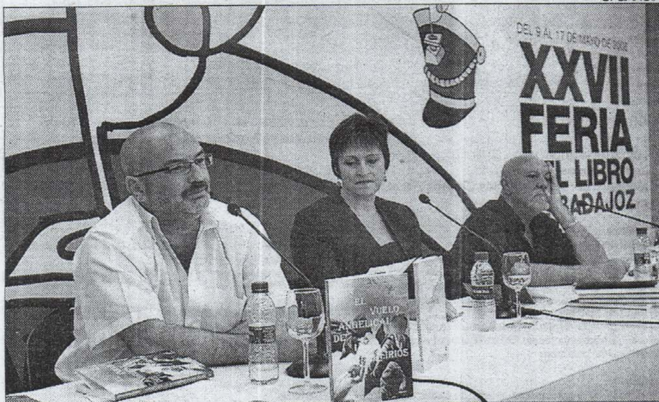
►► Presentación del libro de Mediterráneo en San Atón.