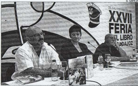
►► Presentación del libro de Mediterráneo en San Atón.

mercado abandonado en una bi- ejemplo muy valioso de este cas-